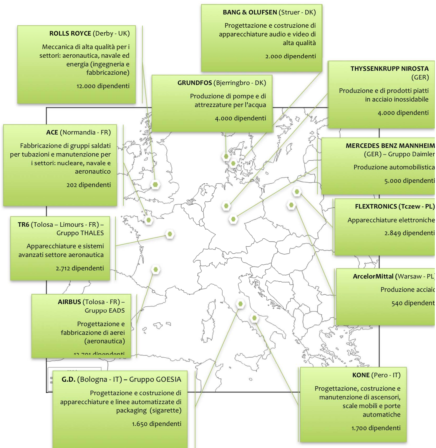
Cartografia degli studi di caso condotti in Europa