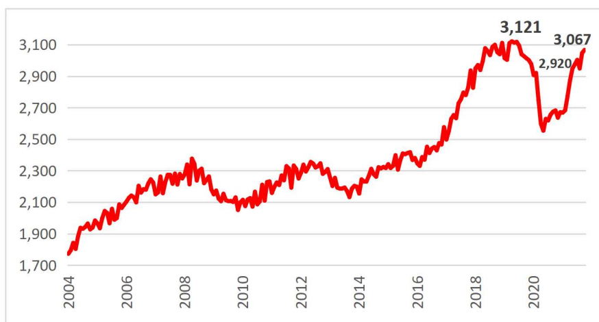
Figura 1 – Occupati dipendenti a termine, gennaio 2004 – ottobre 2021, dati destagionalizzati (in migliaia)

I dati mensili più recenti, riferiti ad ottobre 2021, mostrano che l'occupazione nel suo complesso è ancora sotto i livelli pre-pandemia (-188 mila occupati rispetto a febbraio 2020), mentre i dipendenti a termine sono 3 milioni e 67 mila, un numero maggiore di quello pre-pandemico (2,9 milioni a febbraio 2020) e prossimo al numero massimo rilevato (3,1 milioni ad aprile 2019) (figura 1).